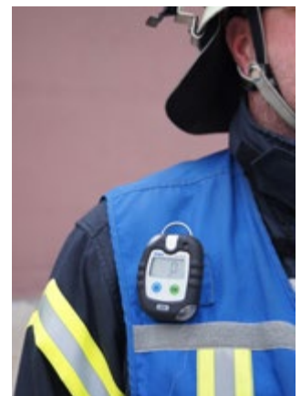
Abb. 1 empfohlene Trageweisen von CO-Warngeräten